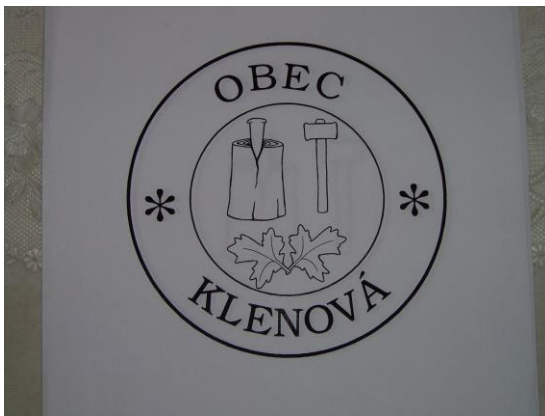
Pečať obce :

2/9 bielej 1/9, zelenej 2/9, žltej 1/9, zelenej 2/9 a žltej 1/9.