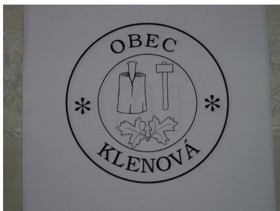
Pečať obce :

2/9 bielej 1/9, zelenej 2/9, žltej 1/9, zelenej 2/9 a žltej 1/9.